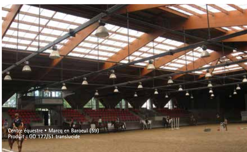
Centre équestre • Marcq en Baroeul (59) Produit : GO 177/51 translucide