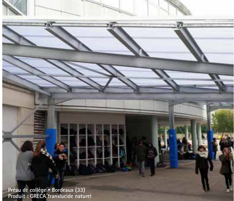
Préau de collège • Bordeaux (33) Produit : GRECA translucide naturel