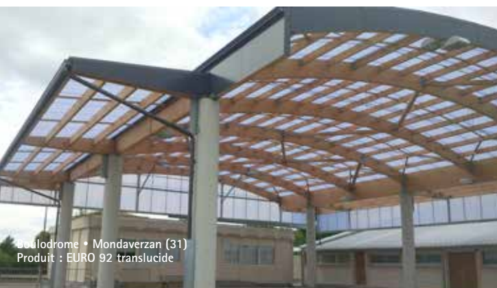
Stadion • Mondaverzan (31) Produit : EURO 92 translucide