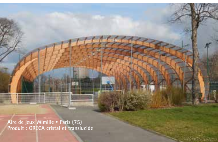
Aire de jeux Wimille • Paris (75) Produit : GRECA cristal et translucide