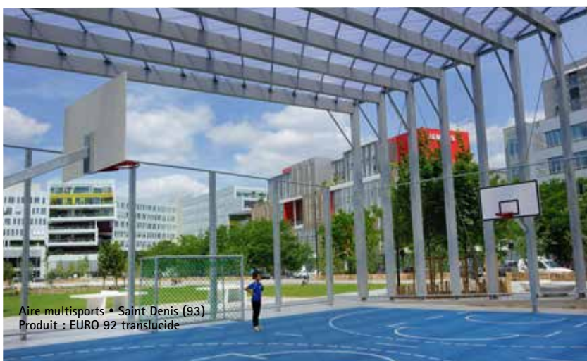
Aire multisports • Saint Denis (93) Produit : EURO 92 translucide