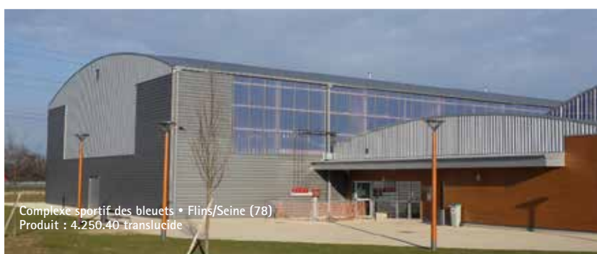
Complexe sportif des bleuets • Flins/Seine (78) Produit : 4.250.40 translucide