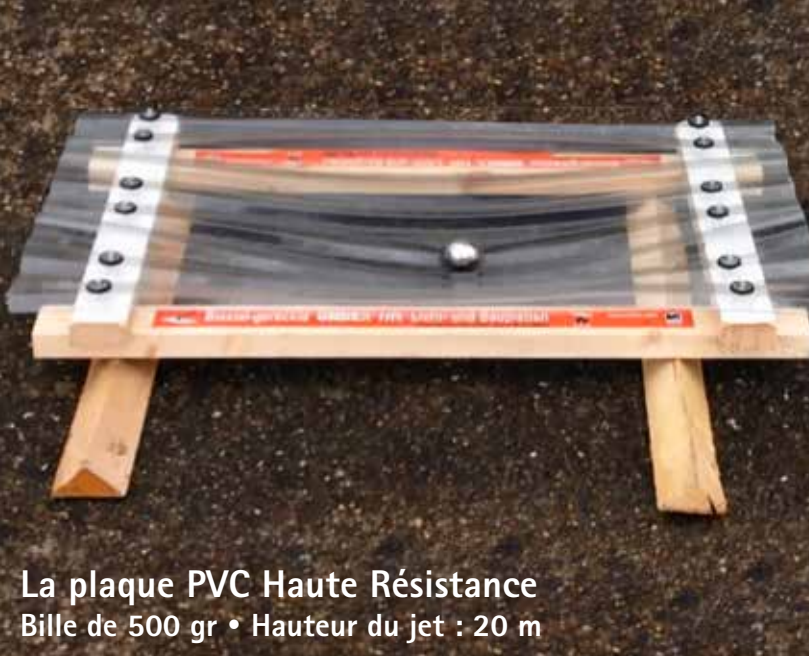
La plaque PVC Haute Résistance Bille de 500 gr • Hauteur du jet : 20 m