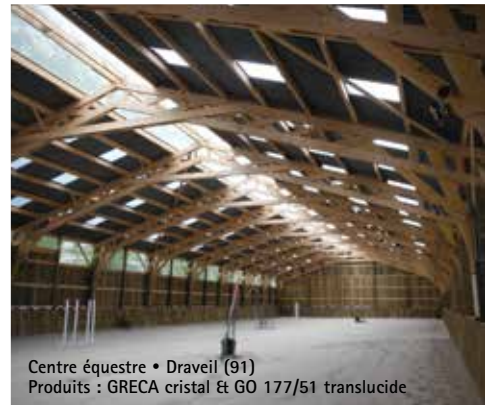
Centre équestre • Draveil (91) Produits : GRECA cristal & GO 177/51 translucide