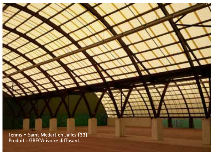
Tennis • Saint Medart en Jalles (33) Produit : GRECA ivoire diffusant