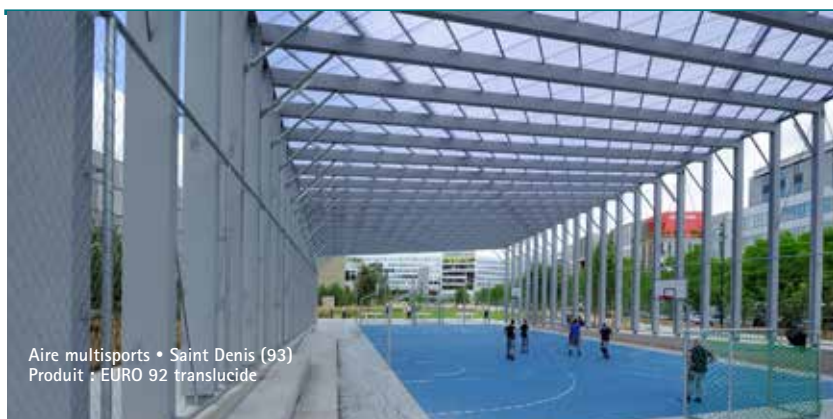
Aire multisports • Saint Denis (93) Produit : EURO 92 translucide