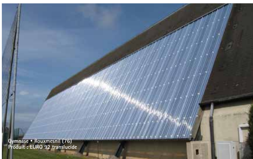
Gymnase • Rouxmesnil (76) Produit : EURO 92 translucide

Tennis couverts • Boulodromes • Stades • Gymnases • Manèges équestres • Salles omnisport • Aires de jeux • Tribunes