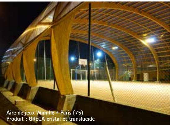
Aire de jeux Wimille • Paris (75) Produit : GRECA cristal et translucide