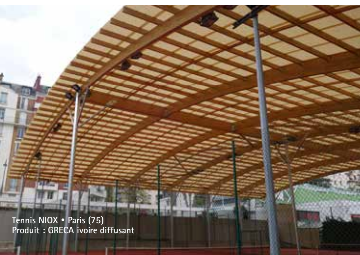
Tennis NIOX • Paris (75) Produit : GRECA ivoire diffusant