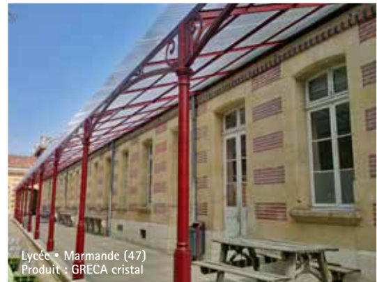
Lycée • Marmande (47) Produit : GRECA cristal